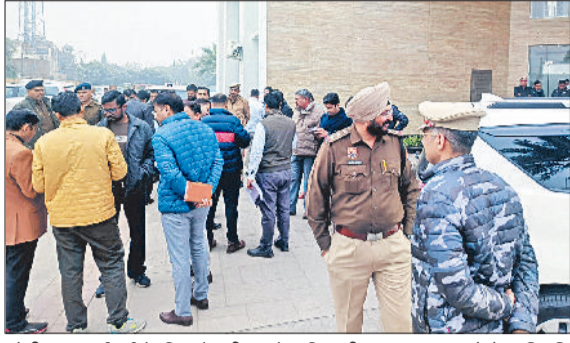
सोनीपत। कार्रवाई के लिए तैयारी करते अधिकारीगण।