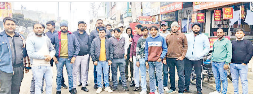
गोहाना। सड़क निर्माण कार्य शुरू करवाने के लिए प्रदर्शन करते हुए दुकानदार।

गैप-4 के चलते गोहाना-महम मार्ग का निर्माण कार्य बंद हो गया है। सड़क पर वाहनों के आने-आने से पूरा दिन धूल के गुब्बार से दुकानदार परेशान हैं। गुरुवार को दुकानदारों ने एकत्रित होकर प्रदर्शन किया और सड़क निर्माण कार्य जल्द पूरा करने की मांग की। दुकानदार बोले कि सड़क पर धूल उड़ती रहने से सांस