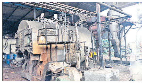
सोनीपत। निर्माणधीन फैक्टरी।