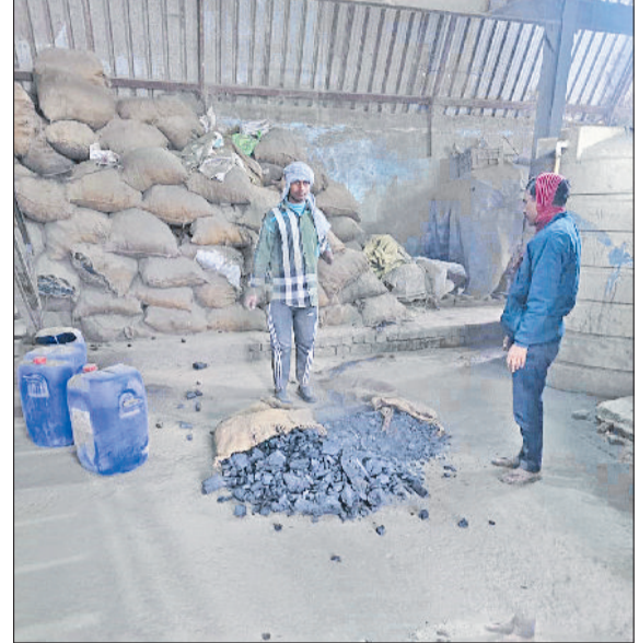
सोनीपत। ईंधन के तौर पर इस्तेमाल किया जा रहा कोयला।

उपाय और निर्माण गतिविधियों की सघन जांच की गई। जहां भी गैप-4 के उल्लंघन पाए गए, वहां तत्काल