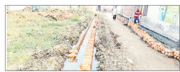
गन्नौर। हरिनगर में ठेकेदार द्वारा कीचड़ में ही चलावाया जा रहा चिनाई का कार्य।

शहर के वार्ड 6 स्थित हरिनगर में नगरपालिका द्वारा नए सिरे से बनवाई जा रही गली के निर्माण कार्य में भारी लापरवाही सामने आई है। स्थानीय लोगों का आरोप है कि गली निर्माण से पहले बनाई जा रही नालियों में पहले से जमा गंदगी की सफाई नहीं करवाई गई। ठेकेदार द्वारा गंदगी और कीचड़ से अटी नालियों में ही ईंटों की चिनाई करवाई जा रही है, जिससे निर्माण की गुणवत्ता पर सवाल खड़े हो रहे हैं। स्थानीय