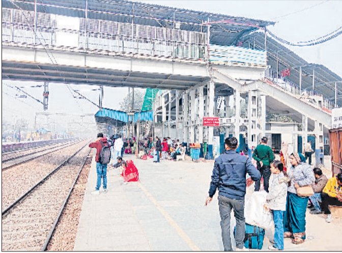
सोनीपत। रेलवे स्टेशन पर रेलगाड़ी का इंतजार करते यात्री व सुबह 11 बजे के करीब छाया कोहरा।

कोहरे के कारण अधिकतम तापमान में आई कमी, आने वाले दिनों में परेशान कर सकता है कोहरा