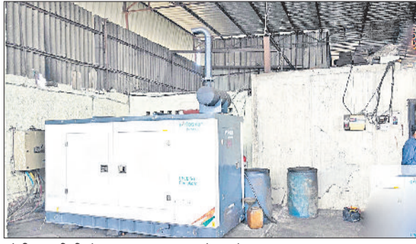
सोनीपत। डीजी सेट व अन्य उपकरण जो चलते पाए गए।