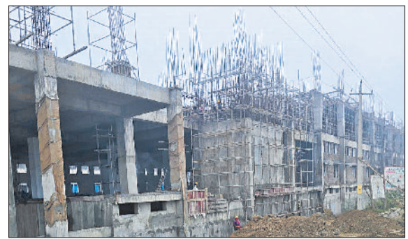
सोनीपत। निर्माणधीन फैक्टरी।

70 से अधिक अधिकारियों ने 20 पिट फर्नेस बंद करवाए, डीजी सेट व कोयला जलाने पर कार्रवाई की संस्तुति